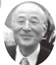
橋本五郎 ジャーナリスト